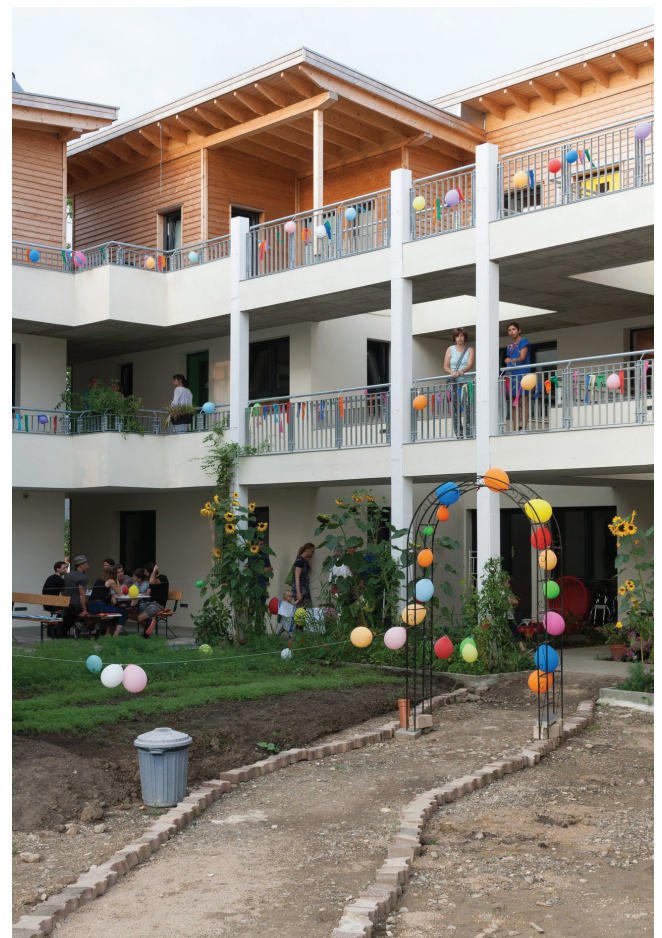
Patchwork - der Bau steht.

Nachtrag: Führung durch das Patchwork-Haus am 27.1.18 in der Schopenhauer Straße: Unter der Führung von Birgitta Hollmann durch „ihr“ Patchworkhaus fanden sich auch dort sehr interessante Aspekte und Eindrücke.