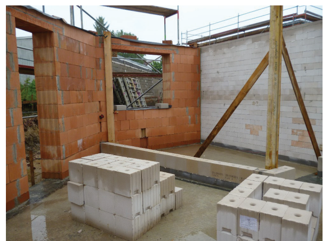
Patchwork in der Bauphase

Massivhäuser sind dagegen z.B. typische mit Steinen erstellte Häuser, die entsprechend außen oder im Stein gedämmt werden.